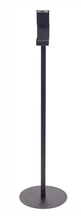
Art nr: 49211 Activa Golvställ 600ml pumpflaska