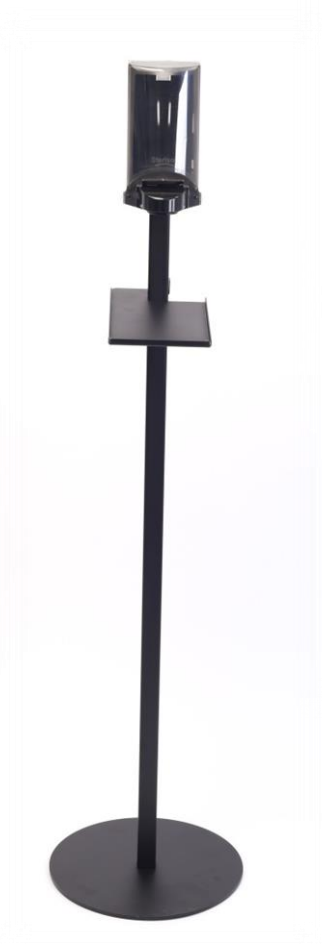
Art nr: 51042 Dispenser Sterisol 0,7L