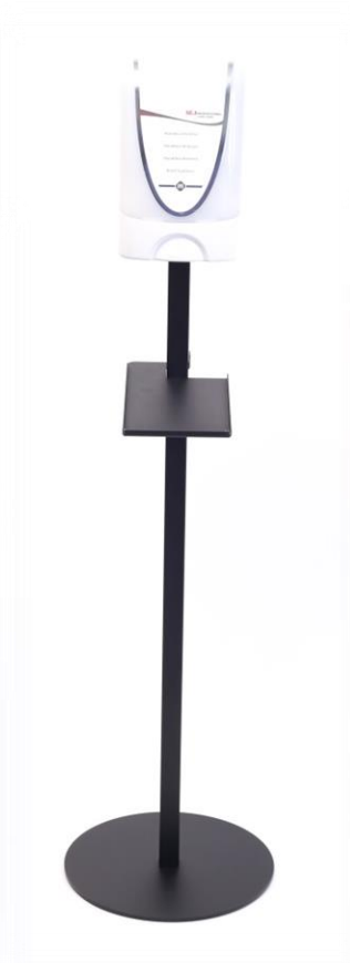
Art nr: 52304 DEB InstantFOAM TF2 TouchFree Dispenser