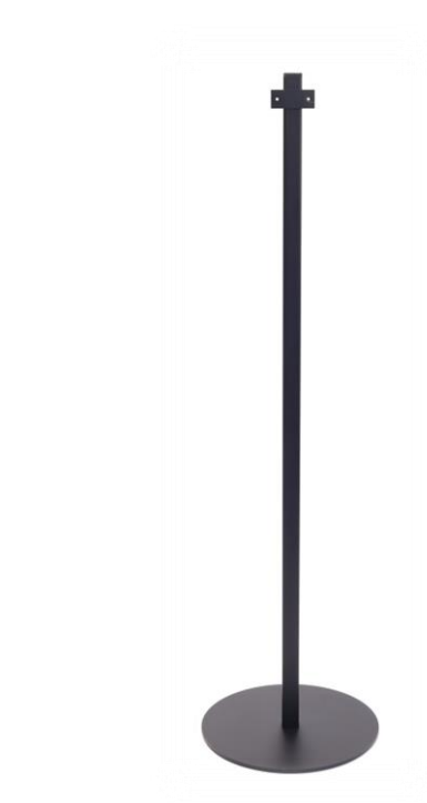
Art nr: 49215 Activa Golvställ Bas