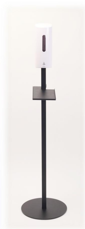
Artnr: 30056 DAX Automatisk dispenser 700ml