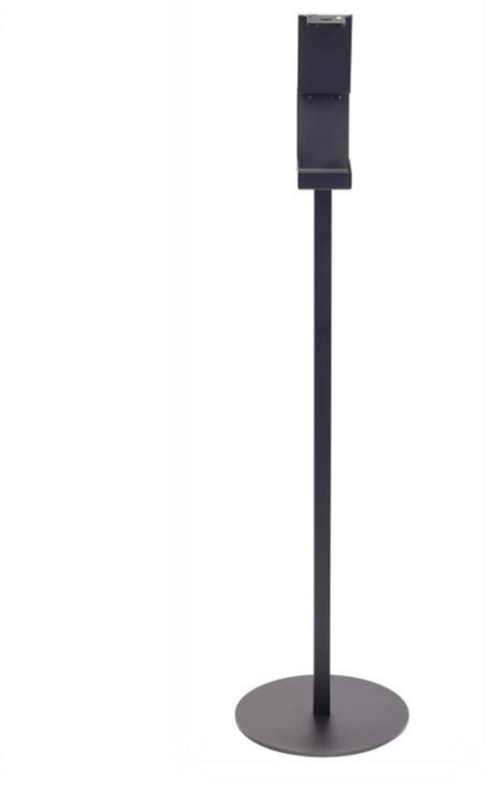
Art nr: 49210 Activa Golvställ 1L pumpflaska