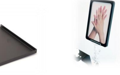
Art nr: 49219 Droppbricka till Golvställ Bas (49215)