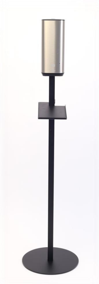
Artnr: 50245 Tork Dispenser skumtvål sensor S4 rostfri