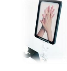
Art nr: 49216 Infoskylt A5 till Activa Golvställ