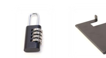
Art nr: 29354 Hänglås med kod till Golvställ medpumpflaska (49210,49211)