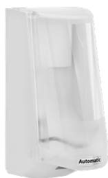
Art. nr. 4546 Automatdispenser 0,7 l, vit med transparent kåpa. EMC-godkänd. Batteridrivnen. Batterier medföljer ej. Mått: 228 x 117 x 130 mm.