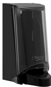
Art. nr. 4552 Dispenser 0,7 l av plast, svart med tonad trans- parent kåpa. Mått: 200 x 115 x 120 mm.