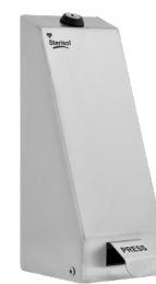
Art. nr. 4569 Dispenser 0,7 l, robust och låsbar av rostfritt stål. Mått: 260 x 102 x 140 mm.