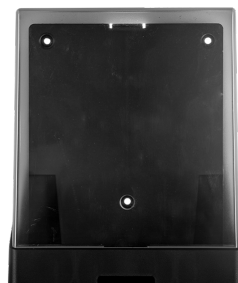
Art. nr. 4535 Dispenser 5 l av plast, svart med tonad trans- parent kåpa. Mått: 250 x 210 x 185 mm.