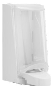
Art. nr. 4551 Dispenser 0,7 l av plast, vit med transparent kåpa. Mått: 200 x 115 x 120 mm.