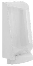
Art. nr. 3551 Dispenser 2,5 l av plast, vit med transparent kåpa. Mått: 340 x 180 x 130 mm.