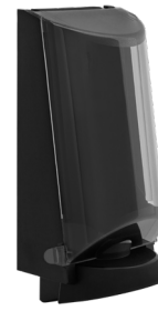
Art. nr. 3552 Dispenser 2,5 l av plast, svart med tonad trans- parent kåpa. Mått: 340 x 180 x 130 mm.