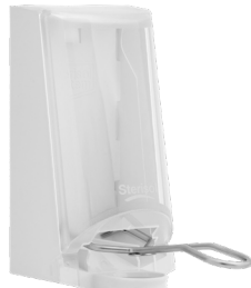
Art. nr. 4567 Dispenser 0,7 l av plast, vit med transparent kåpa. Underarmsdoser- are av metall. Mått: 200 x 110 x 200 mm.