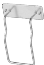
Art. nr. 4573 Sängfäste av metall. Passar alla Sterisol dispensrar 0,7 l.