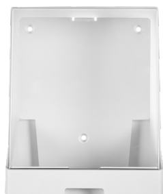
Art. nr. 4531 Dispenser 5 l av plast, vit med transparent kåpa. Mått: 250 x 210 x 185 mm.