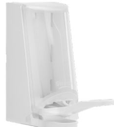
Art. nr. 4547 Dispenser 0,7 l av plast, vit med transparent kåpa. Underarmsdoser- are av plast. Mått: 200 x 110 x 200 mm.